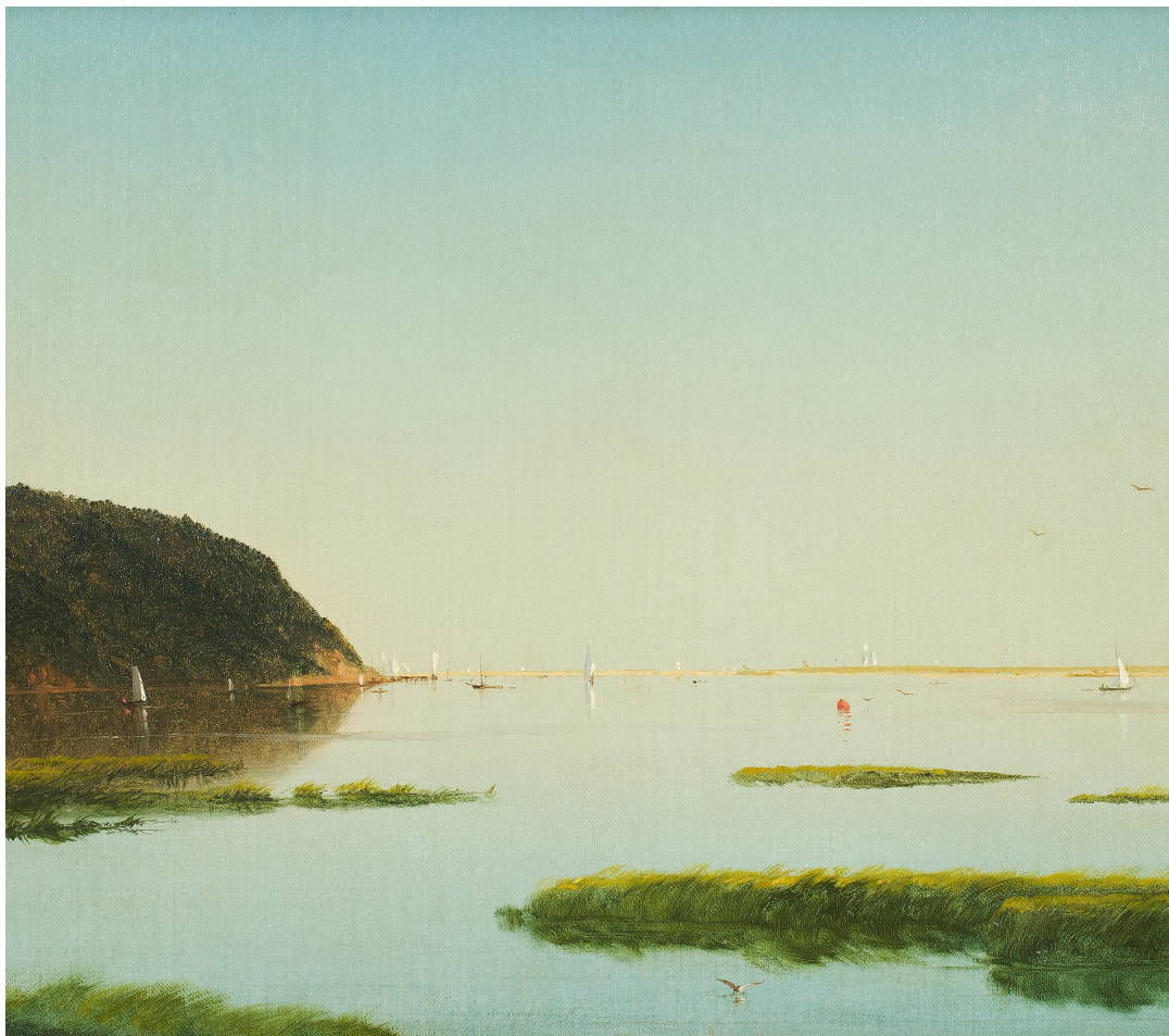
Pohled na řeku Shewsbury (1859), John Frederick Kensett

Vážení spoluobčané Informace z 16. zasedání zastupitelstva obce Slovo preventisty Vážení rodiče